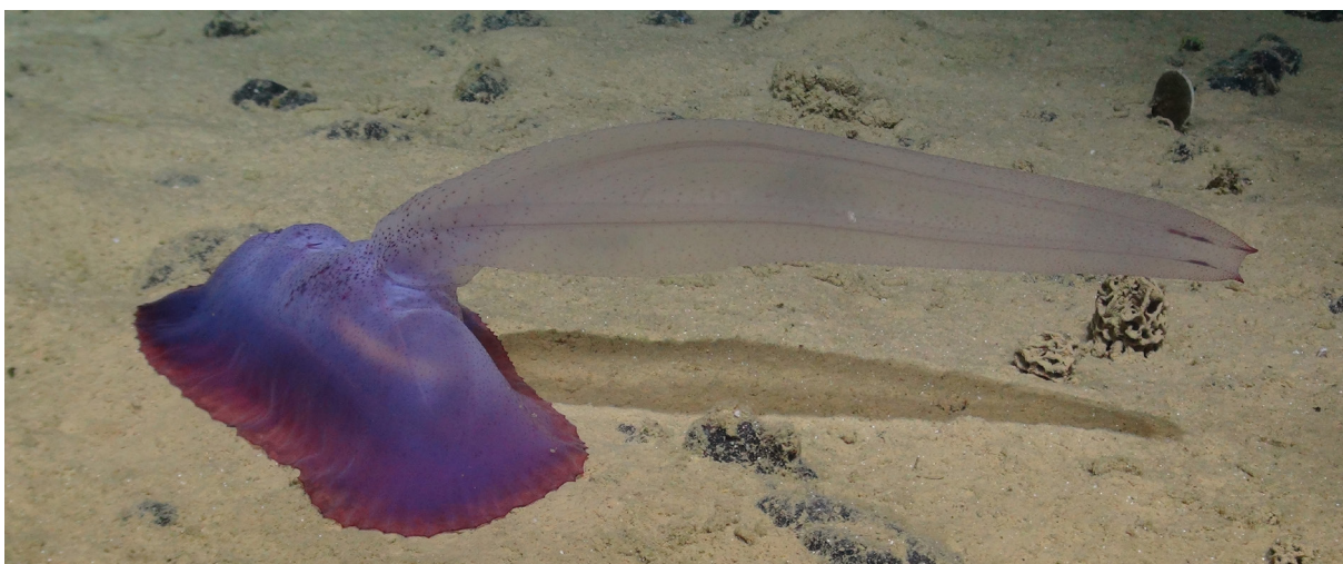
Este pepino de mar es relativamente nuevo para la ciencia y se encuentra en la zona Clarion-Clipperton, situada en el noreste del océano Pacífico. También conocida coloquialmente como “ardilla de goma”, es solo una de las innumerables especies que podrían beneficiarse de una moratoria de la minería del fondo marino en la región y más allá.

Algunas de las preocupaciones más importantes sobre la minería del fondo marino se refieren a cuatro ámbitos: ciencia, gobernanza, equidad y economía.