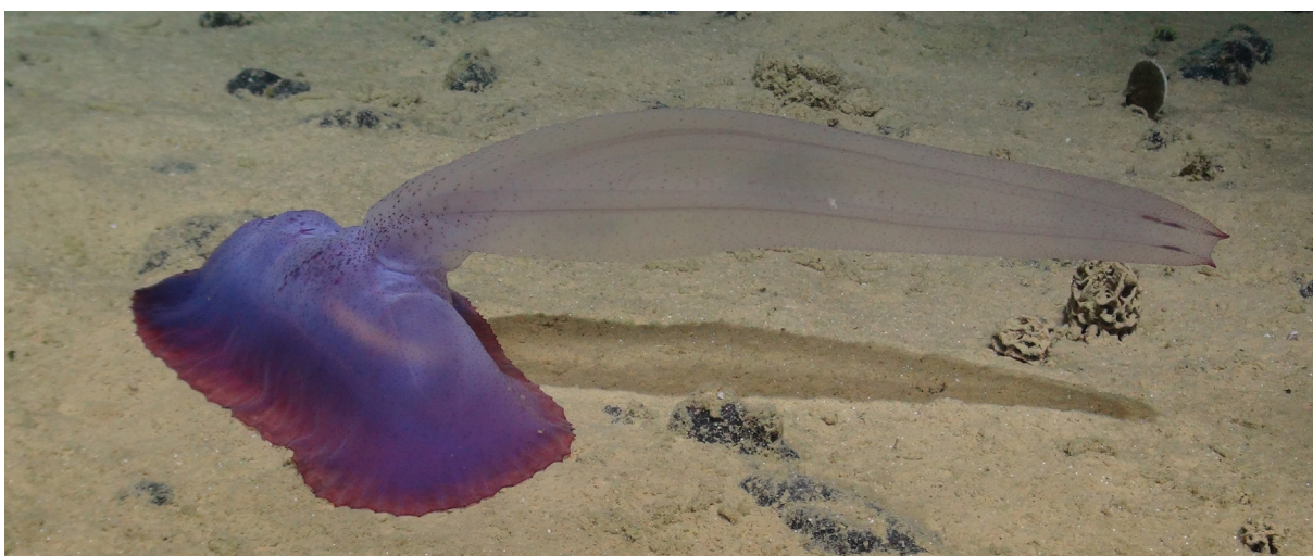
Ce concombre de mer, relativement nouveau pour la science, se trouve dans la zone de Clarion-Clipperton, située dans l'océan Pacifique nord-est. Appelé familièrement « écureuil gommeux », il n'est qu'une des innombrables espèces qui pourraient bénéficier d'un moratoire sur l'exploitation minière des fonds marins dans la région et au-delà.

Certaines des préoccupations les plus importantes concernant l'exploitation minière des fonds marins relèvent de quatre domaines : la science, la gouvernance, l'équité et l'économie.